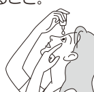
容器の先が目、まぶた、まつ毛にふれないように